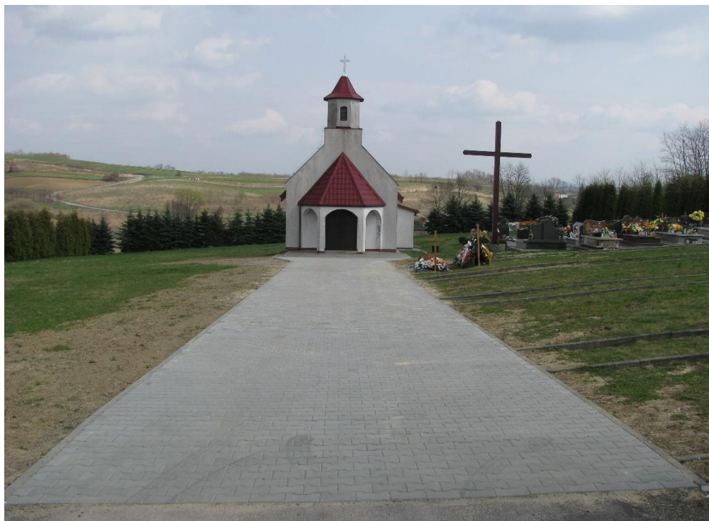
Alejka na cmentarzu komunalnym w Lubicy