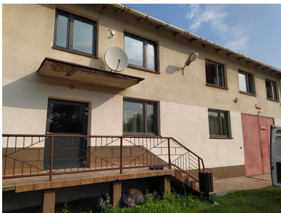
Dom Ludowy i Remiza OSP w Lubicy