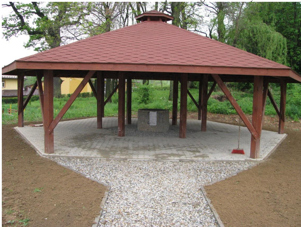
Siłownia plenerowa i wiata z paleniskiem do grilla w Lublicy