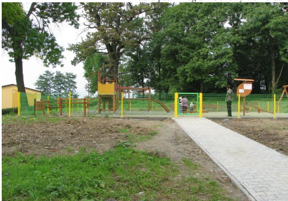
Ogólnodostępny plac zabaw w Lublicy