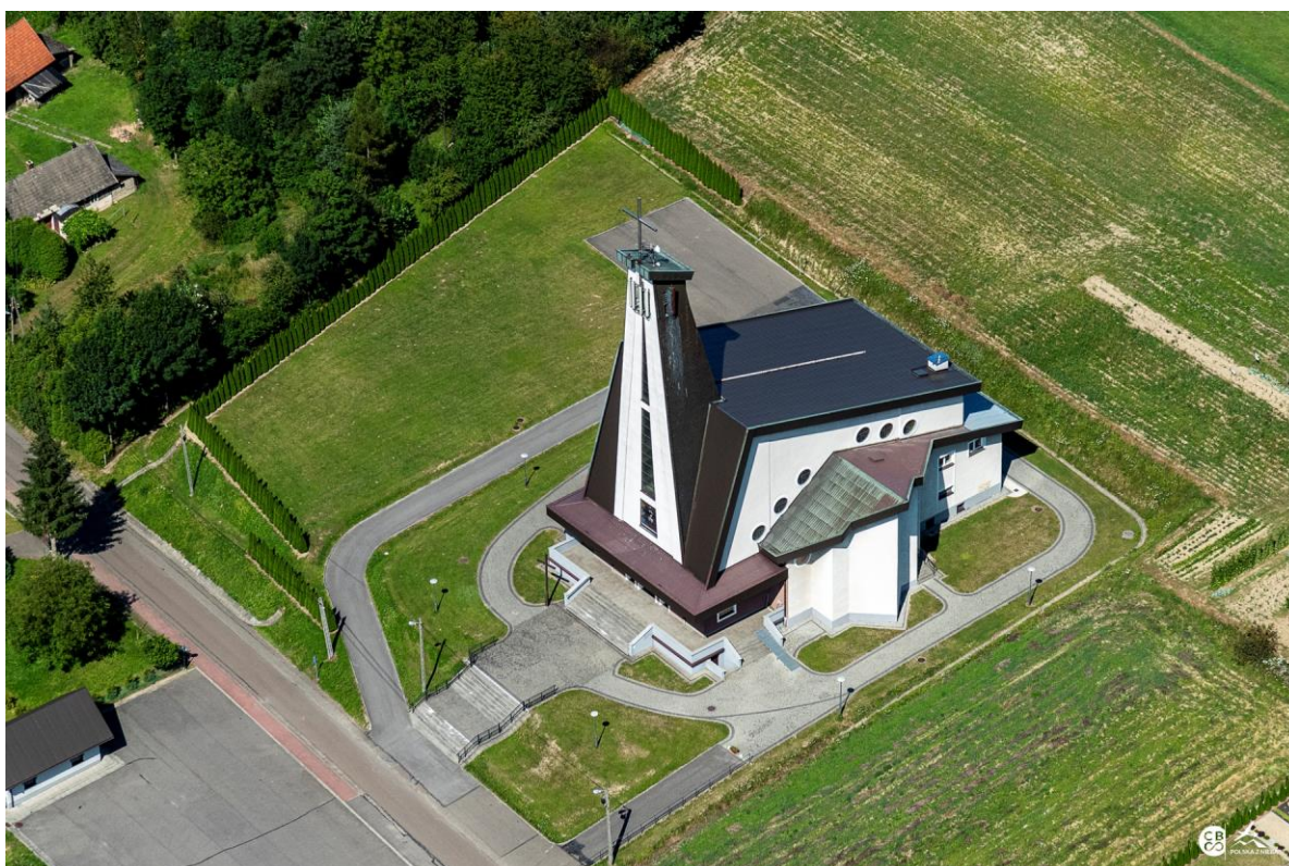
Kościół w Lublicy