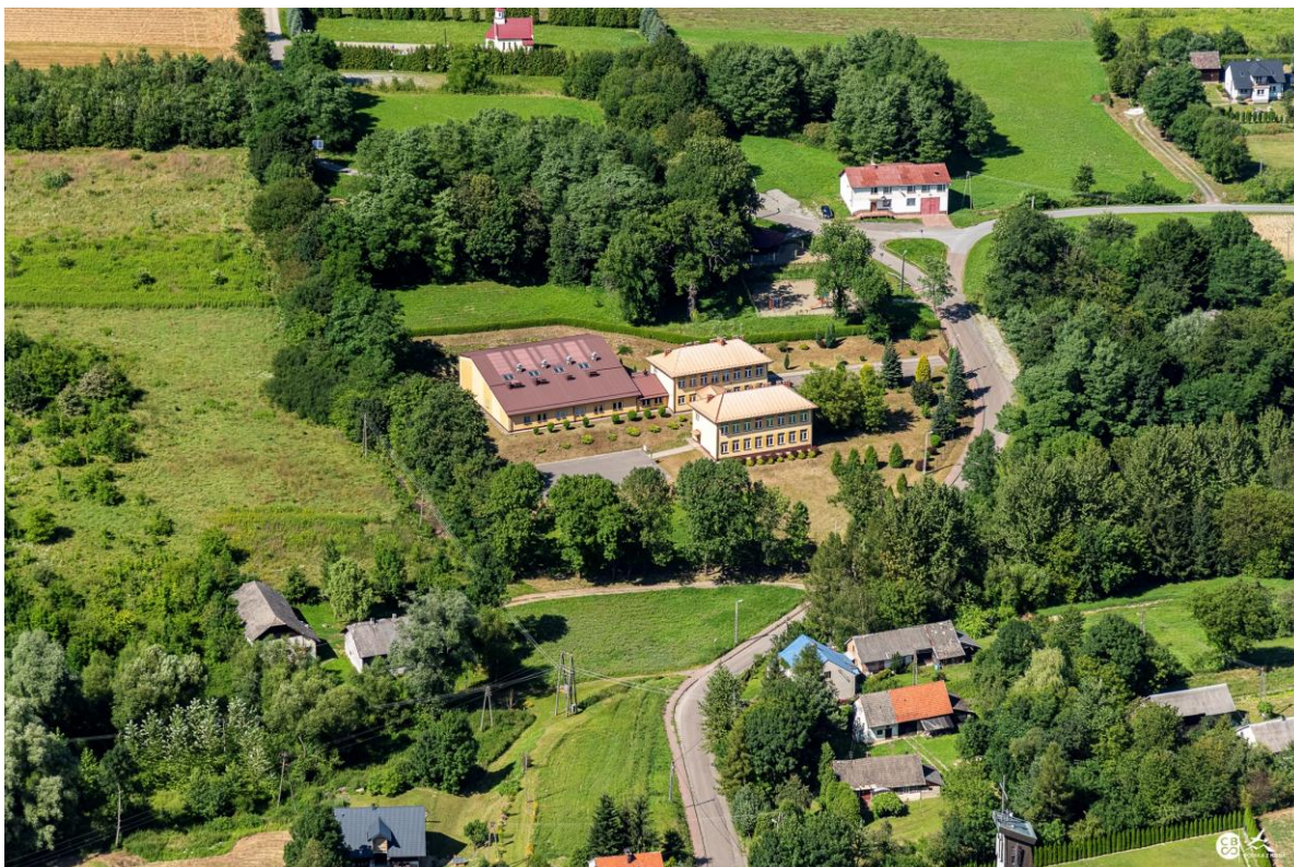
Zespół Szkół Społecznych w Lublicy