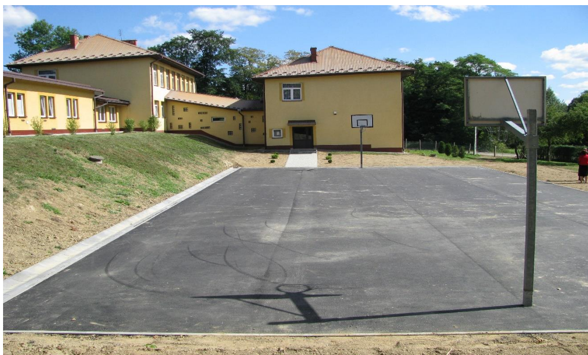
Boisko sportowe przy Zespole Szkół w Lublicy